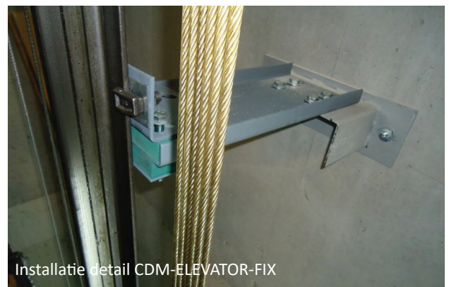
Installatie detail CDM-ELEVATOR-FIX