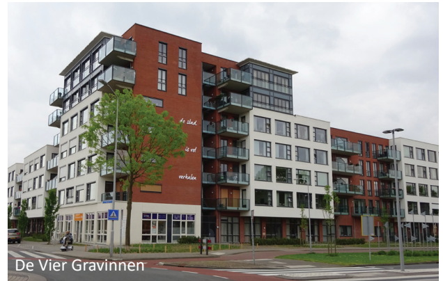
De Vier Gravinnen

Vanwege het succes is ook de lift in gebouwdeel Isolde van hetzelfde woon-zorgcomplex onder handen genomen. Ook hier is de lift en de liftmotor ontkoppeld d.m.v. het CDM-ELEVATOR-FIX systeem om de geluidsoverlast weg te nemen.